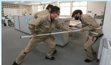
さすまたを用いて侵入者を確保